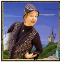
Estelle Farfadelle Pour les 3 à 9 ans